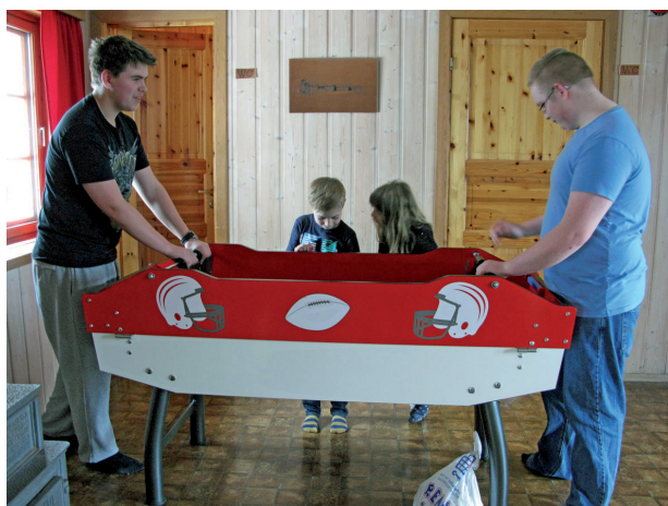
Leik og moro for både store og små!