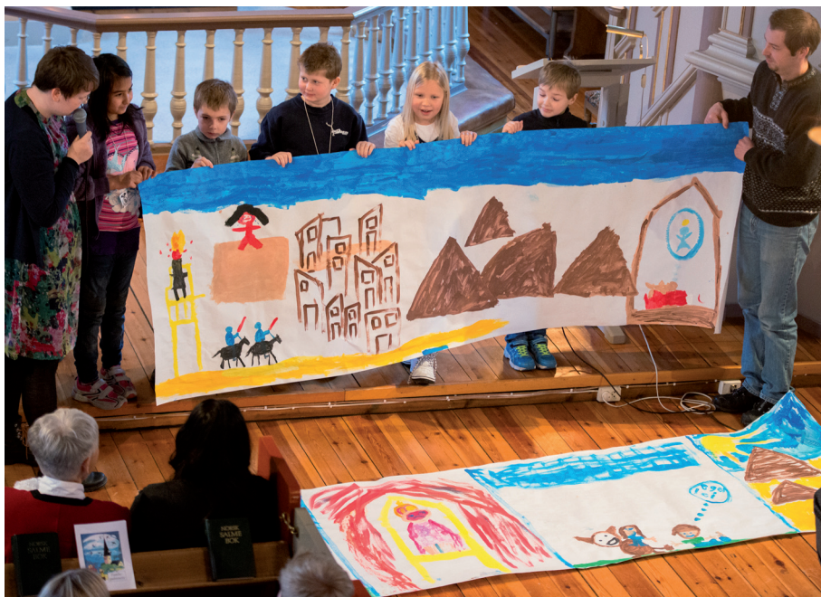
Her viser dei flinke tårnagentane fram dei fine teikningane dei har laga av flukten til Egypt