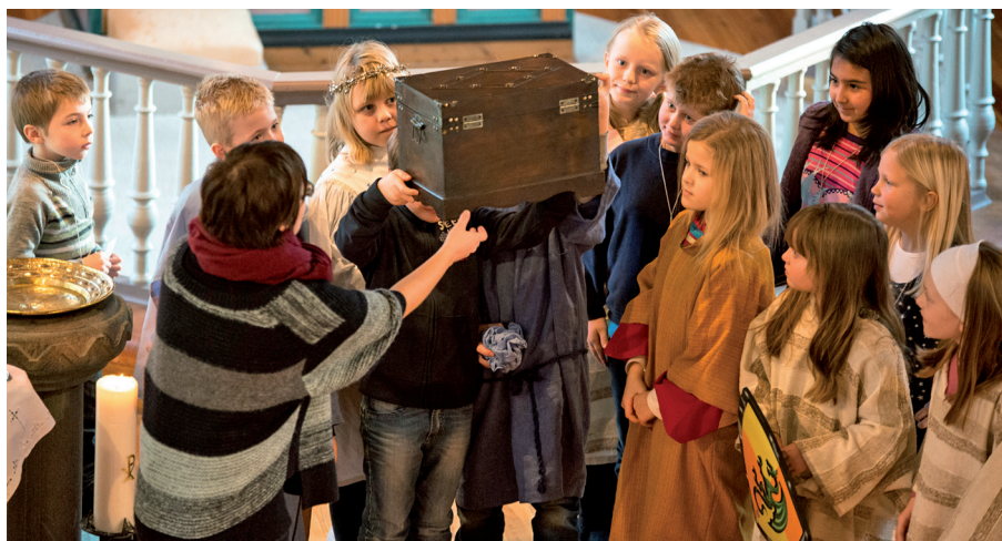
Tårnagentane har funne ei skattkiste, og er veldig spente på kva som gøymer seg oppi den!

Den 18.-19.januar var det mange flotte tårnagentar i kyrkjene, som utforska og undersøkte kva spanande som gøymer seg i kyrkjene og i Bibelen av symbol, skattar og mysterium. Dei fekk mellom anna utdelt eige agentskilt med nummer og navn og fekk smaka ekte agentmat! Om laurdagen måla dei historien om då Maria, Josef og Jesusbarnet måtte røma til Egypt for å sleppe unna den sinte kong Herodes. Dette framførte dei under gudstenesta på søndagen.