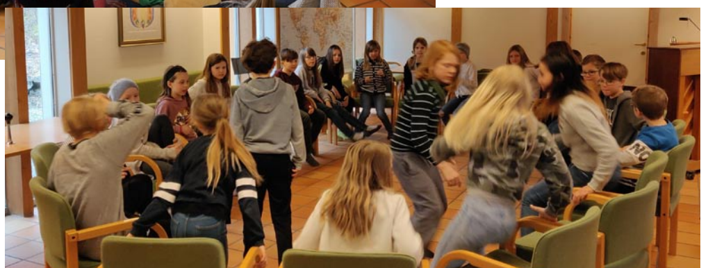
T.v: "Krolledag" for 3-åringane. Under: Leik på "Kompis"