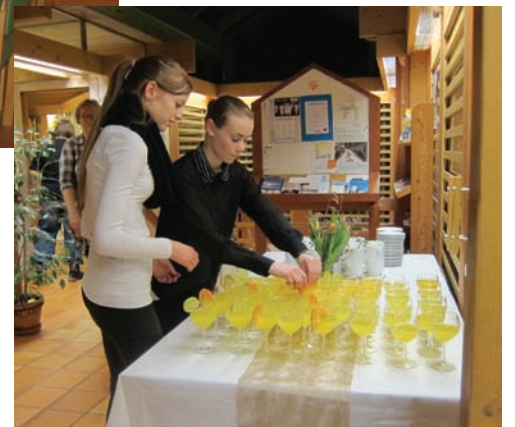
Konfirmantane lagar fruktputsj til gjestane

vart det – og det på ein heilt vanleg tysdagskveld! Ein del tok i mot invitasjonen til å vera med på Alphakurs etterpå, så dei møtest om måndagskveldane