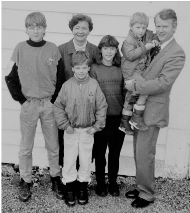
Slik såg familien Aase ut då dei kom til Samnanger for 25 år sidan.

- Det kjennest vanskeleg at dei truande er så spreidde i bygda vår. Draumen min er at me saman skulle teikna eit tydeleg og varmt bilete av Jesus, Frelsaren vår, slik at alle skulle sjå det. ARH