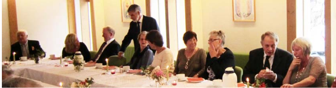
Det er kjekt å treffast og pratast!